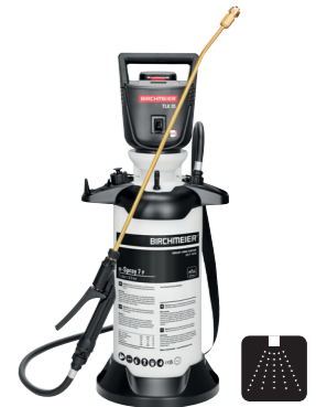
e-Spray 7 P

Der leistungsstarke Akku-Kompressor sorgt für eine konstant hohe Förderleistung, während der grosse, stabile Standfuss mit integrierter Sprührohrhalterung für sicheren Stand und praktisches Handling sorgt – auch unter anspruchsvollen Bedingungen.