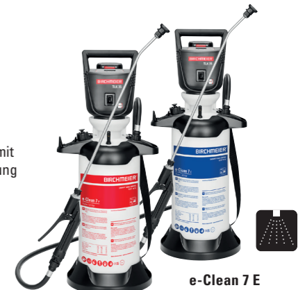
e-Clean 7 P

Komfortable und effiziente Reinigung dank des speziell für den Einsatz mit Säuren oder Laugen entwickelten Geräts. Das Gerät mit dem grossen, stabilen Standfuss mit integrierter Sprührohrhalterung sorgt für sicheren Stand.