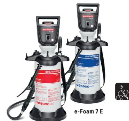
e-Foam 7 P

Der gesamte Tankinhalt kann ohne Unterbruch vollständig entleert werden, was eine grossflächige und zeitsparende Reinigung ermöglicht. Das Gerät mit dem grossen, stabilen Standfuss mit integrierter Schaumrohrhalterung sorgt für sicheren Stand.